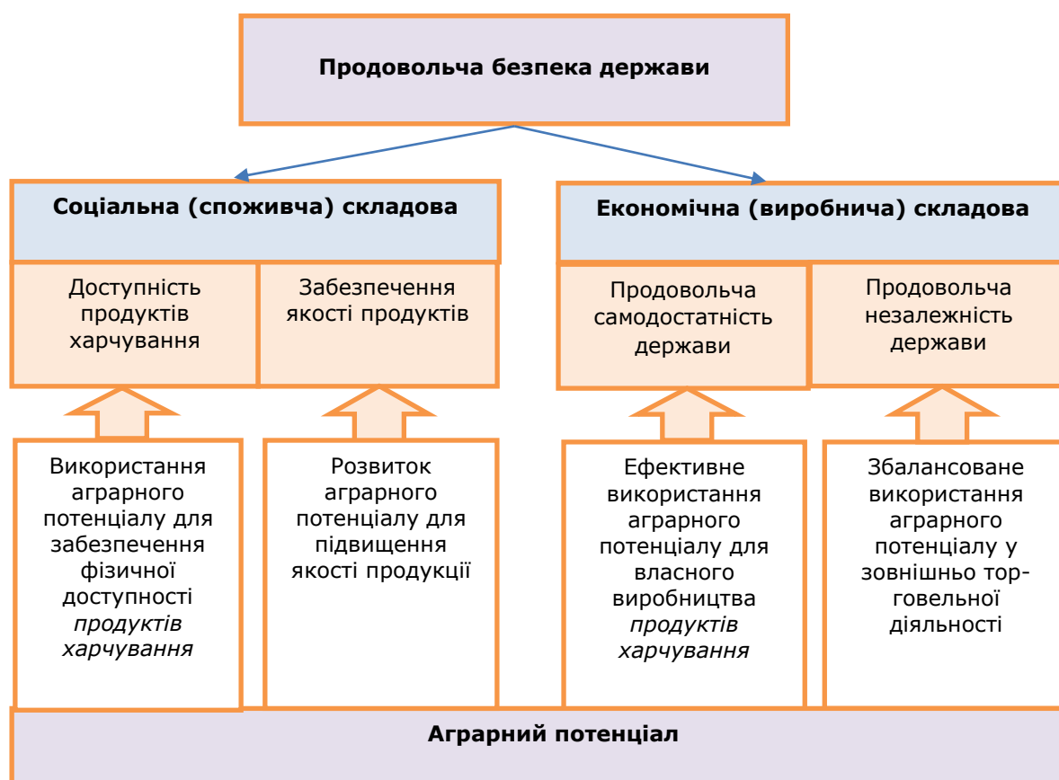
Рисунок 2 – Роль аграрного потенціалу у забезпеченні продовольчої безпеки держави